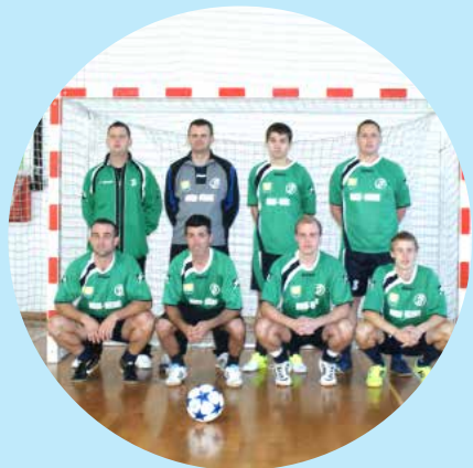
Nogometna ekipa MDGN Velenje

Cilji programa so: socializacija, integracija v slišče okolje, ohranjanje in izboljšanje zdravja, ohranjanje psihofizične kondicije, razvijanje osebne iniciative in vztrajnosti, pridobivanje samozavesti, spoznavanje novih ljudi, prilagajanje družbi in okolici, zadovoljevanje potreb po druženju in s tem sproščanju.