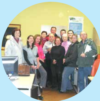
Računalniški tečaj v sodelovanju z Ljudsko univerzo Velenje

Program prispeva k izboljšanju izenačevanja možnosti oseb z okvaro sluha za neodvisno življenje in nudi oporo pri vključevanju v družbeno okolje. Oviranost uporabnikov v komunikaciji, nevidna invalidnost, nizka stopnja osveščenosti o njihovih pravicah in nerazumevanje informacij s strani izvajalcev javnih storitev povečajo socialno izključenost. V okviru tega programa uporabnikom in njihovim družinam ter svojcem nudimo osebno pomoč pri soočanju s težavami, stiskami in pri reševanju nepredvidenih situacij. Gre za opredelitev in pomoč pri prepoznavanju socialne težave ali stiske in oceno možnih rešitev, seznanjanje uporabnikov s socialno varstvenimi storitvami, dajatvami, pravicami in obveznostmi ter predstavitev mreže izvajalcev, ki lahko uporabniku nudijo