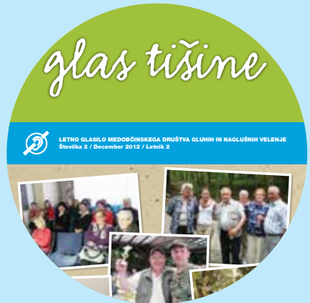
Interno glasilo GLASTIŠINE

Posledice okvare sluha se najbolj kažejo na področju sporazumevanja, dostopnosti do komunikacij in informacij ter pri aktivnem vključevanju v življenje in delo v družbi. Mediji niso prilagojeni posebnim potrebam oseb z okvaro sluha, zato s tem programom premagujemo komunikacijske ovire. Zaradi komunikacijske oviranosti, nerazumljenih tujk in vsebine so osebe z okvaro sluha v neenakopravnem položaju v primerjavi s slišječimi. Program zajema navezovanje stikov in sodelovanje z različnimi institucijami in lokalno skupnostjo. Uporabnike in širšo javnost redno obveščamo o aktivnostih v društvu ter tudi o pravicah in posebnih potrebah te populacije. Člane o dejavnostih društva in njihovih pravicah obveščamo preko obvestil na oglasni deski v društvu, elektronske pošte, javnih medijev (lokalna televizija in teletekst), časopisnih člankov v lokalnih časopisih Naš čas, Savinjske novice in reviji Iz sveta tišine, pisno preko pošte, z sms sporočili, na sestankih in na predavanjih. Prav tako pa želimo širšo javnost preko predstavitev in prispevkov v medijih seznaniti s problematiko okvare sluha in pravicami, ki pripadajo tem ljudem. Program zajema tudi sodelovanje pri oblikovanju prispevkov na spletni strani ZDGNS, sodelovanje v oddaji Prisluhnimo tišini in pri ustvarjanju časopisa