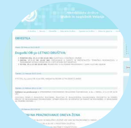
Spletna stran http://www.mdnjvelenje.si/