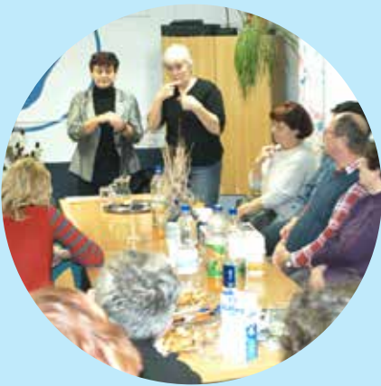
Predavanje o novi socialni zakonodaji

Namen programa je usposabljanje oseb z okvaro sluha za aktivno, samostojno življenje in delo ter preko informiranja o novostih in zanimivostih z vseh življenjskih področij, seznanjanja z novimi besedami in kretnjami izboljšati pismenost in razumevanje. Pomemben cilj je krepitev samozavesti in samopodobe ter sprejemanje samega sebe. Poudarek pa je tudi na neformalnem druženju in koristnem preživljanju prostega časa. Eden izmed pomembnih ciljev je doseganje večje enakovrednosti pri vključevanju v življenje in delo, prepoznavanje in reševanje osebnih stisk preko vključevanja posameznika v proces soustvarjanja rešitve. V okviru tega uporabnikom nudimo osebno asistenco in psihosocialno pomoč. Trudimo se dosegati tudi zagotavljanje pravic oseb z okvaro sluha ter, preko povezovanja z lokalno skupnostjo, njihovo večjo socialno vključenost. Tudi starše in svojce želimo