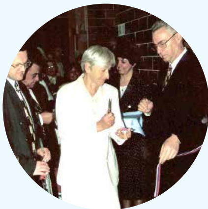
Otvoritev novih prostorov na Efenkovi 61 v Velenju leta 1998

Prvega aprila 1998 se je društvo preselilo v nove prostore na Efenkovi 61 , v katerih deluje še danes. Sredstva zanje je v največji meri prispevala Zveza gluhih in naglušnih Slovenije, nekaj pa tudi Mestna občina Velenje. Slavnostna otvoritev novih prostorov je bila 16. maja 1998, ko je društvo obeležilo tudi 35 let svojega delovanja . Na njej so najzaslužnejšim članom podelili priznanja, v bogatem kulturnem programu pa so nastopili otroci, tudi sami z okvaro sluha. V tem