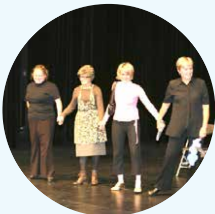
Prvič uprizorjena igra v senci (vsak igralec ima senco tolmača) na Mednarodnem dnevu gluhih v Velenju

Leta 2004 je društvo odkupilo prostore na Efenkovi 61 v Velenju, v katere se je iz prostorov na cesti Bratov Mravljak 1 preselilo leta 1998.