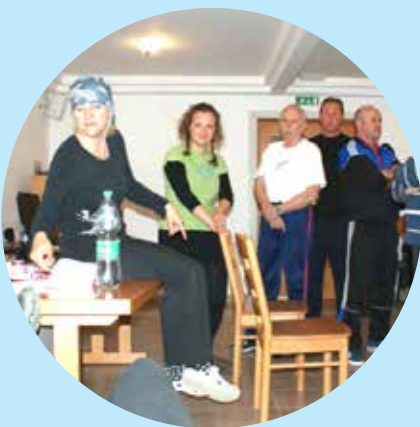
Udeležba članov v gledališki delavnici

Kultura je področje, kjer se lahko osebe z okvaro sluha udeležujejo, popestrijo dogajanje in pokažejo svoje izrazne sposobnosti. V Sloveniji je dobila poseben pomen s priznanjem znakovnega jezika. Druženje s sebi enakimi, pridobivanje informacij, izmenjave izkušenj so za osebe z okvaro sluha izrednega pomena, saj so sproščeni in pozabijo na svoje težave. Zaradi komunikacijskih ovir gluhe in naglušne osebe težje sodelujejo z ostalimi amaterskimi gledališkimi skupinami. Program obsega vključevanje v kulturne aktivnosti, pripravo gledaliških predstav, deklamacij, obeleževanje pomembnih kulturnih in ostalih dogodkov, različne ustvarjalne delavnice in predavanja.