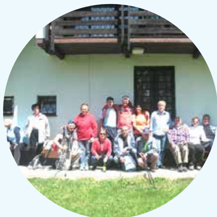
Pohod na Lubelo 2012

V letu 2012 so bili posebni programi izvedeni v enakih okvirih kot v letu 2011, le da je program usposabljanje za aktivno življenje in delo ter preprečevanje socialne izključenosti gluhoslepih združen s programom gluhih in naglušnih. V mesecu septembru se je osemindeset članic in članov udeležilo praznovanja mednarodnega dne in 50-letnice krškega društva gluhih in naglušnih – oboje je organiziralo to društvo. Podeljeni so bili tehnični pripomočki, razdeljenih je bilo tudi kar precej prehrabnih paketov za socialno šibkejše, izvedeni so bili tudi obiski na domu. V decembru je izšla druga številka letnega glasila Glas tišine.