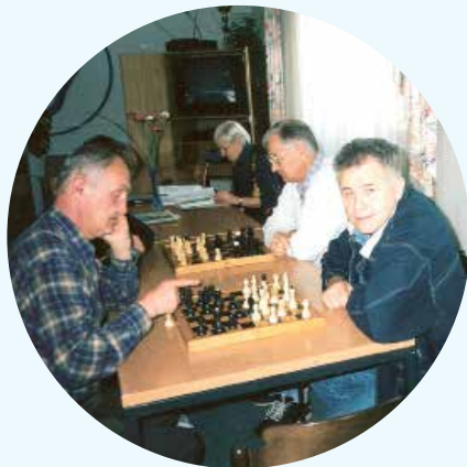
Šah ob sredah

V mesecu aprilu 1988 je bila v prostorih Zveze društev upokojencev v Titovem Velenju letna skupščina MOSP Titovo Velenje . Udeležilo se je je 42 članov in članic, poleg njih pa so bili še predstavniki socialnega skrbstva, socialna delavka iz Mozirja in predstavniki velenjskega invalidskega društva. Udeleženci skupščine so med drugim ugotovili, da društvo dela v izredno težkih pogojih, saj jim za redno dejavnost primanjkuje denarja. Nujno