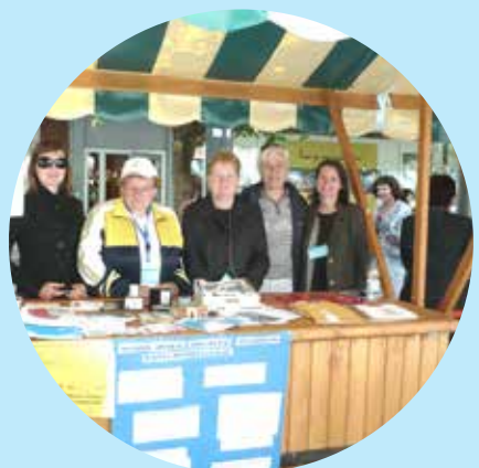
Stojnica na festivalu prostovoljstva v Mestni občini Velenje