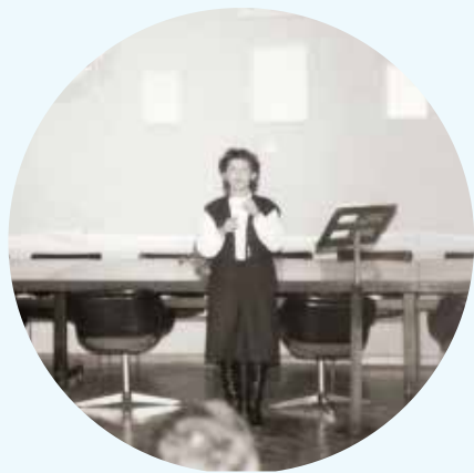
Proslava v Šoštanju ob 20-letnici društva 1983, prvič prevedena v znakovni jezik

Na pomoč naj bi jim priskočili krajanji, ki so v svojih okoljih poznali ljudi z okvaro sluha in bi društvu sporočili njihove naslove.